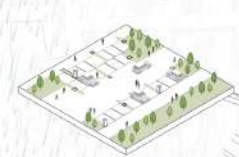
Realizzazione e riqualificazione di aree con pavimentazioni permeabili destinate ai parcheggi