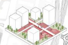
Realizzazione di piazze di quartiere con nuclei centrali, spazi pubblici e aree di aggregazione